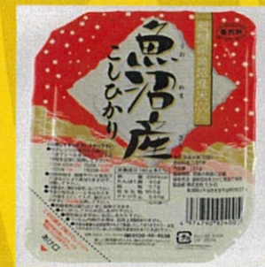
新潟県魚沼産 こしひかり 10個 2592円