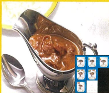
〈資生堂パーラー〉 カレー&ハヤシビーフ セット4種 計7箱5400円