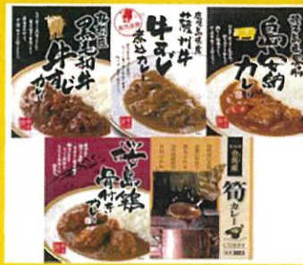
九州カレー5種セット 5種計5箱 3780円