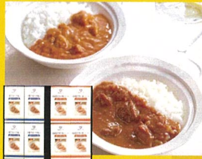
〈帝国ホテル〉十勝牛・ 日向鶏カレーセット 2種計8箱 4320円