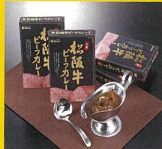
松阪牛ビーフカレー 4箱 7560円