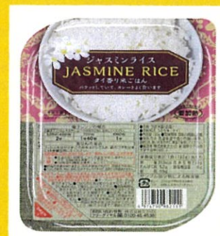
ジャスミンライス 10個 2592円