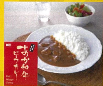
あか和牛カレー 4箱 3780円