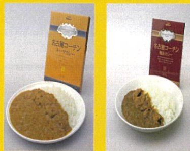
名古屋コーチンカレー 2種計4箱 3780円